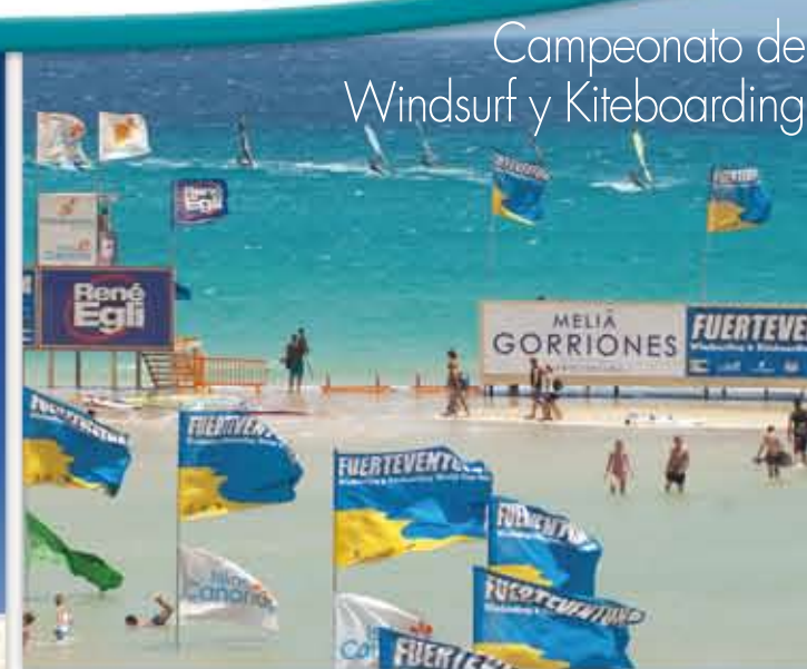
Campeonato de Windsurf y Kiteboarding