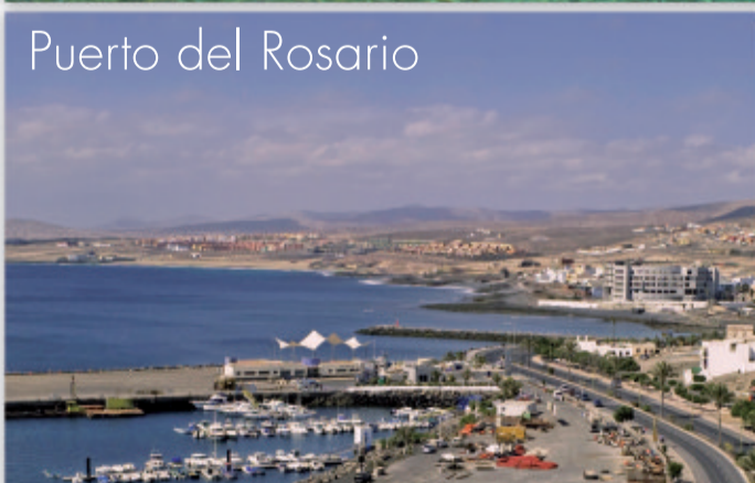
Puerto del Rosario