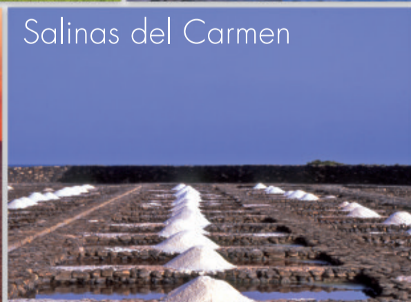
Salinas del Carmen