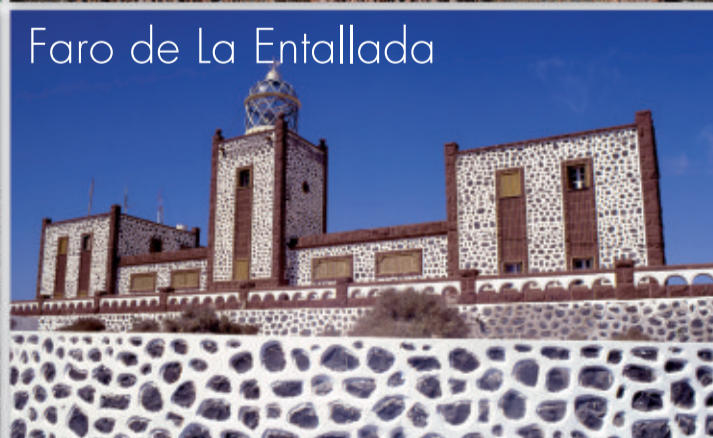
Faro de La Entallada