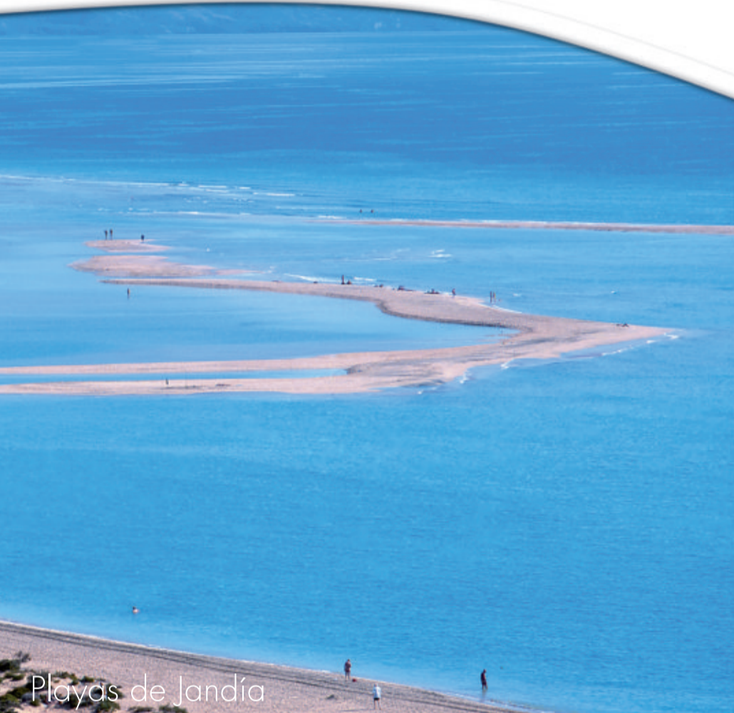
Playas de Jandía