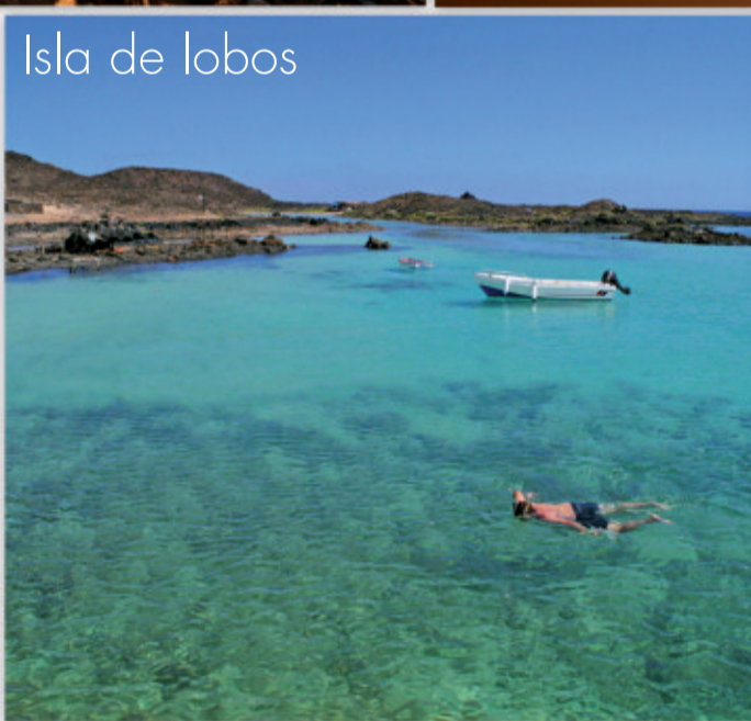
Isla de lobos