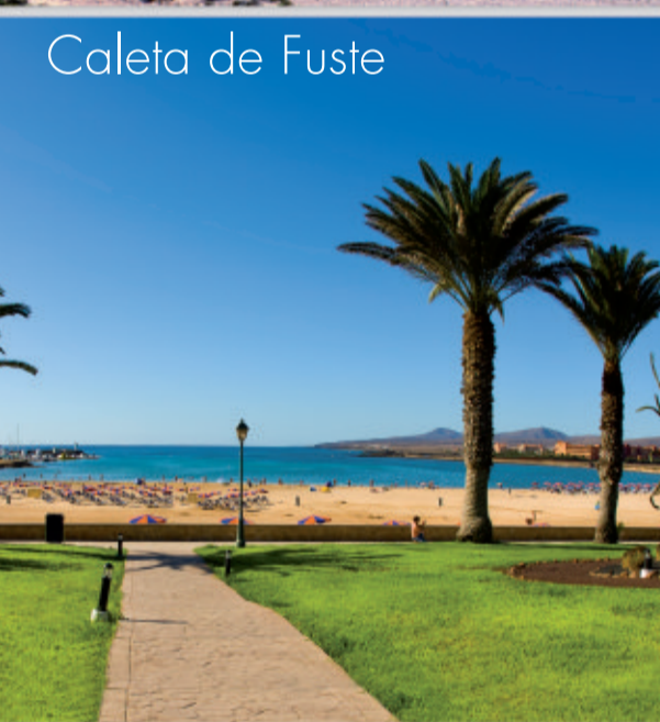
Caleta de Fuste