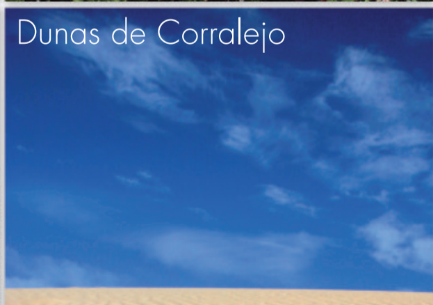
Dunas de Corralejo